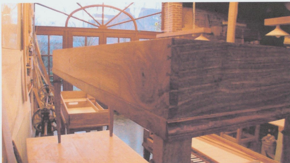
同じく Tollembeek の工房にて